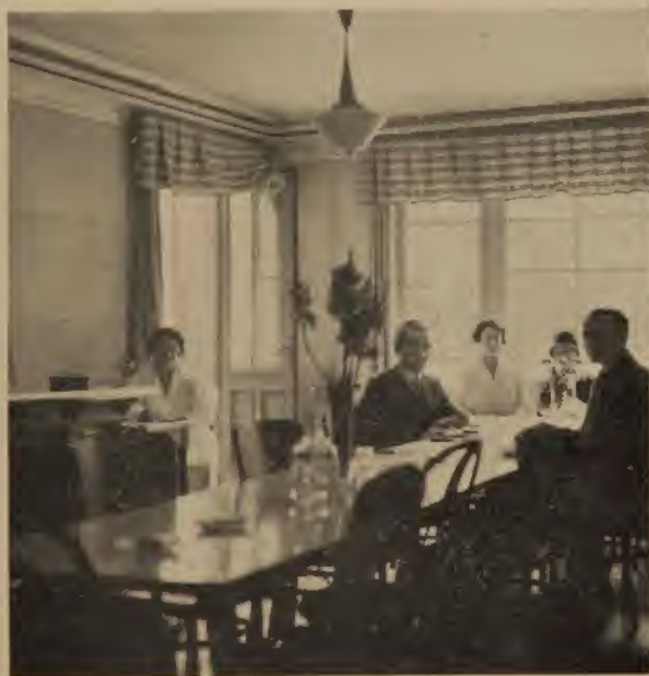
Esszimmer der Mittelstandsküche des Israelitischen humanitären Frauenvereins.